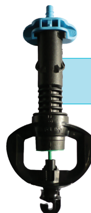
SuperNet™ UD LR STIC , Connecteur d'entrée Auto-taraudante

Codes catalogue manquants disponibles sur demande.